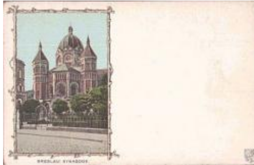
Postkarte ca. 1900

Zwei Jahre später kam ich zum Jungvolk. Besondere Freude machte es uns wenn wir, als Marschkolonne, in Stadtviertel einschwenkten in denen viele Juden wohnten. Dann brüllten wir, singen konnte man dazu nicht sagen, fürchterliche Hetzlieder. "Schmeißt sie raus die ganze Judenbande, schmeißt sie raus aus unserm Vaterlande.... Der restliche Text, denn ich auch noch weiß, ist so schlimm, dass ich ihn nicht zitieren möchte. Oder wir sangen "Krumme Juden zieh'n dahin daher, sie zieh'n durchs Rote Meer, die Wellen schlagen zu, die Welt hat Ruh".