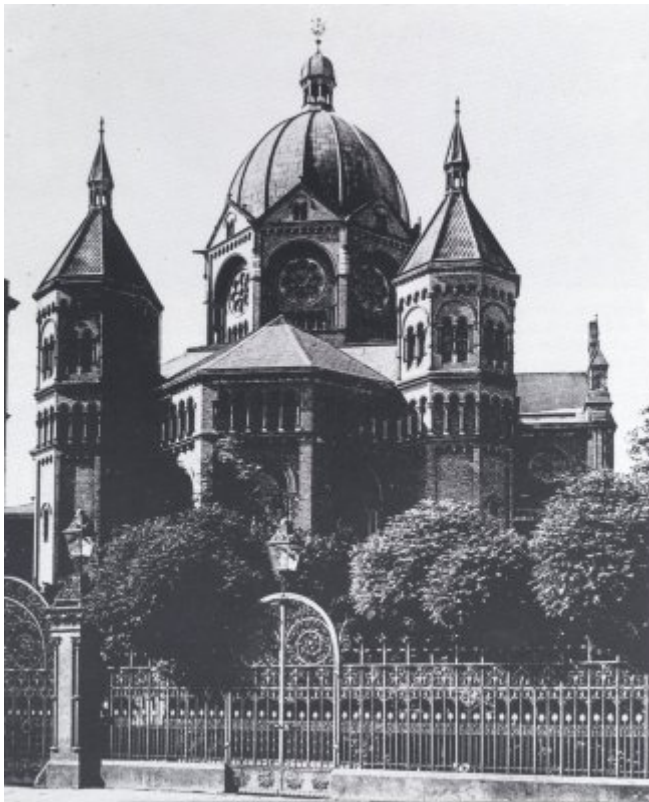
Neue Synagoge (Foto vor 1938)

Kuppel, umgeben von vier kleineren Ecktürmchen; die Synagoge hatte eine besonders imposante Fensterrosette über dem Hauptportal.