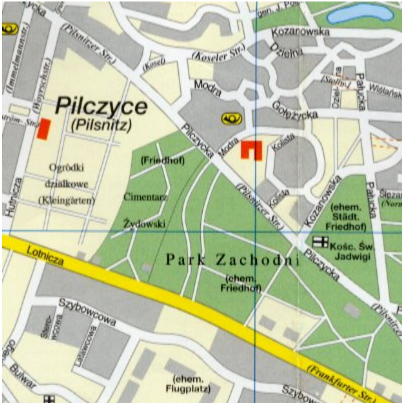
Auszug aus dem Stadtplan von Breslau