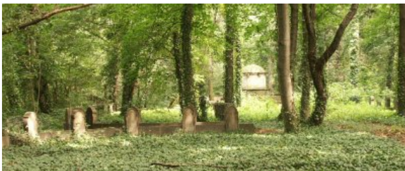
Jüdischer Soldatenfriedhof mit Pantheon