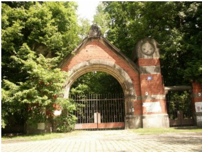
Eingang zum Friedhof

An der Frankfurter Straße (heute ul. Lotnicza) liegt der Neue Jüdische Friedhof (heute Cimentarz Żydowski). Er wurde 1902 gegründet. Auf sieben Hektar befinden sich rund 20000 Gräber. Davon sind 95% ehemalige deutsche Begräbnisstätten. Hier liegen die ärmeren, meistens die unbekannteren Juden.