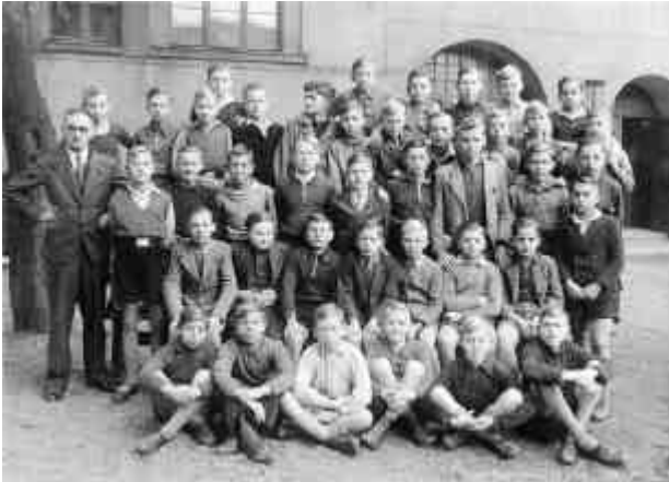
33. Volksschule - 7. Schuljahr - 1943