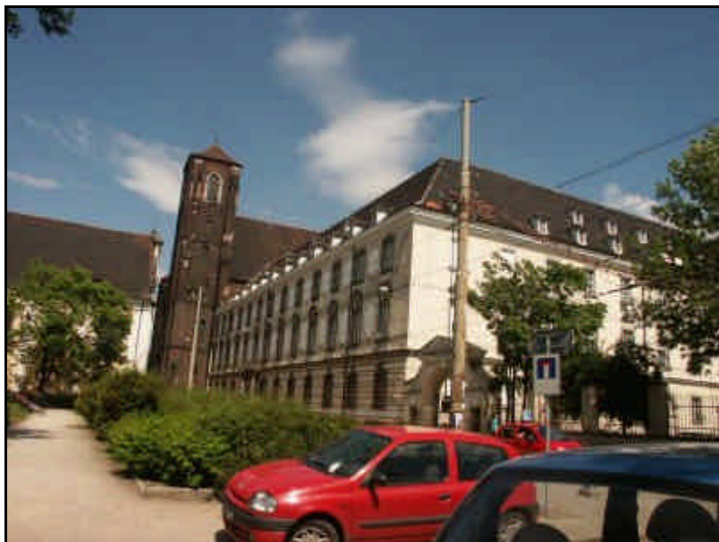
Die Universitätsbibliothek. Foto 2005