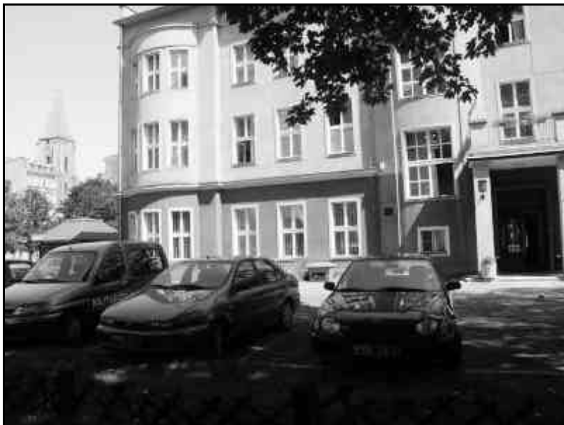
Standesamt 1, Foto 2005