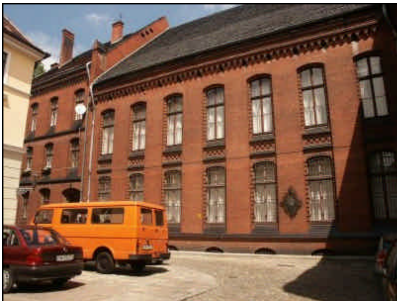
Breslauer Staatsarchiv. Foto 2005