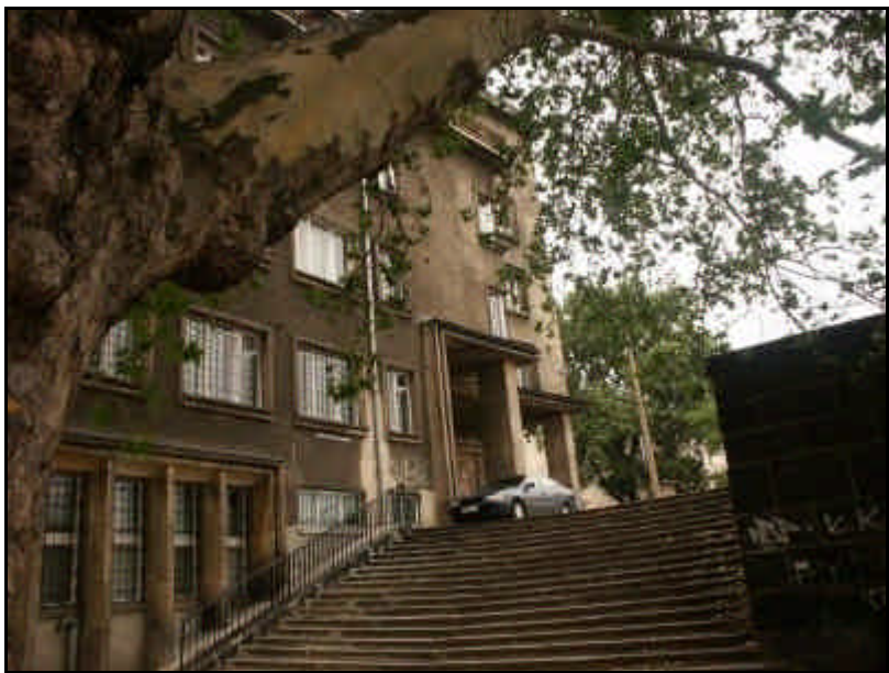
Breslauer Staatsarchiv. Foto 2005