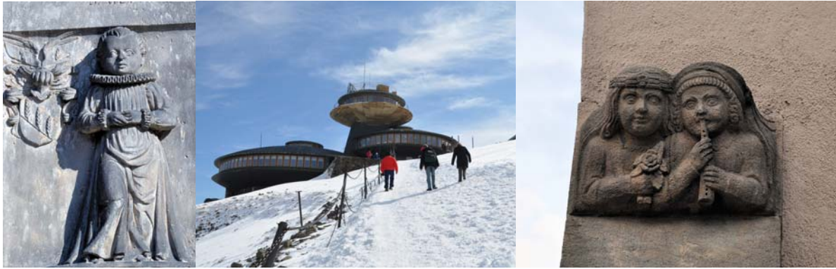
Bunzlau – Schneekoppe – Löwenberg