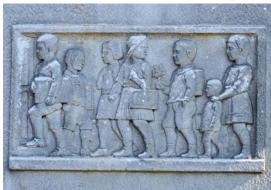
Schule in Bunzlau

Während meiner Rückfahrt durchlebe ich alle Stationen noch einmal. Es hat sich gelohnt unterwegs zu sein, um interessierten Menschen sagen zu können, dass es sich lohnt, nach Polen zu fahren. Es gibt Naturschönheiten und europäische Geschichte zu entdecken. In meiner Reiseauswertung bin ich auf die Befreiungskriege gestoßen. In Bunzlau soll Napoleon sich kurz aufgehalten haben. In drei Jahren findet erneut die Jubiläumsfeier zu den Befreiungskriegen statt. Hans Poelzig baute mit am Ausstellungsgelände zur Jahrhundertfeier vor fast 100 Jahren. Mir scheint, dass alles Kleine in einem großen Zusammenhang steht. Vielleicht auch diese Reise?