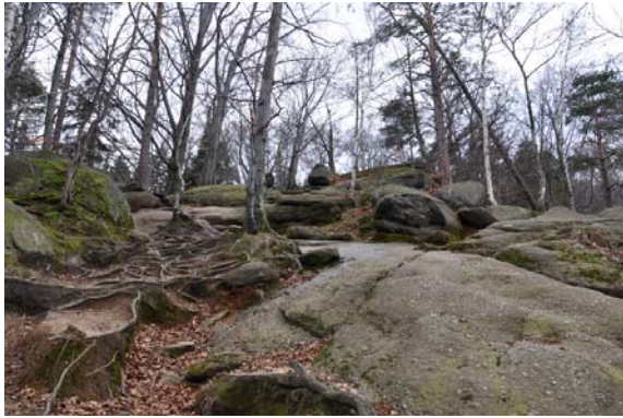
Steiler steiniger Aufstieg