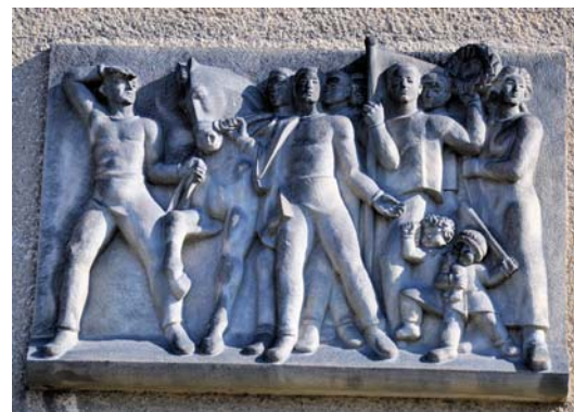
Sparkasse in Bunzlau