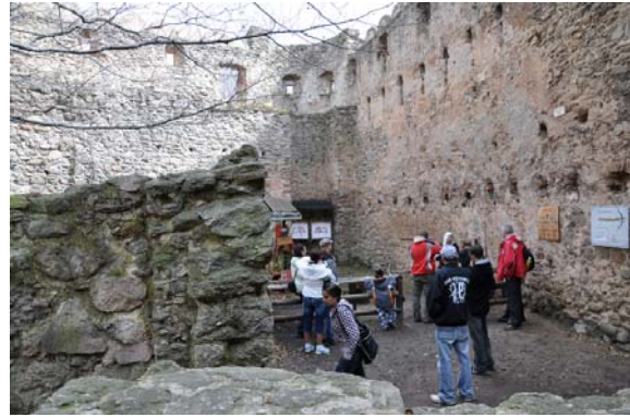
Armbrustschießen im Burghof

Ich setze meine Fahrt in Richtung Hirschberg fort und komme so gegen 13:00 Uhr an. Was soll ich jetzt noch unternehmen? Für einen Spaziergang auf die Kynastburg habe ich noch genügend Zeit. Diesen Weg kenne ich inzwischen. Alte Postkarten und auch schlesische Reiseberichte haben mich auf diese Burg aufmerksam gemacht. Von oben hat man einen schönen Überblick über das Hirschberger Tal bis zum Riesengebirge. Mein Weg führt mich über den Felsenanstieg zur Burg. Einige Polen nutzen die Zeit und das Wetter, um zur Burg zu wandern. Ein „Ritter“ zeigt den Besuchern, wie man mit der Armbrust umgeht. Väter nutzen die Chance, um sich im Armbrustschießen auszuprobieren. Die Sicht ist gut und es soll am Ostersonntag sehr schön werden, so dass ich beschließe, die Schneekoppe zu besteigen.